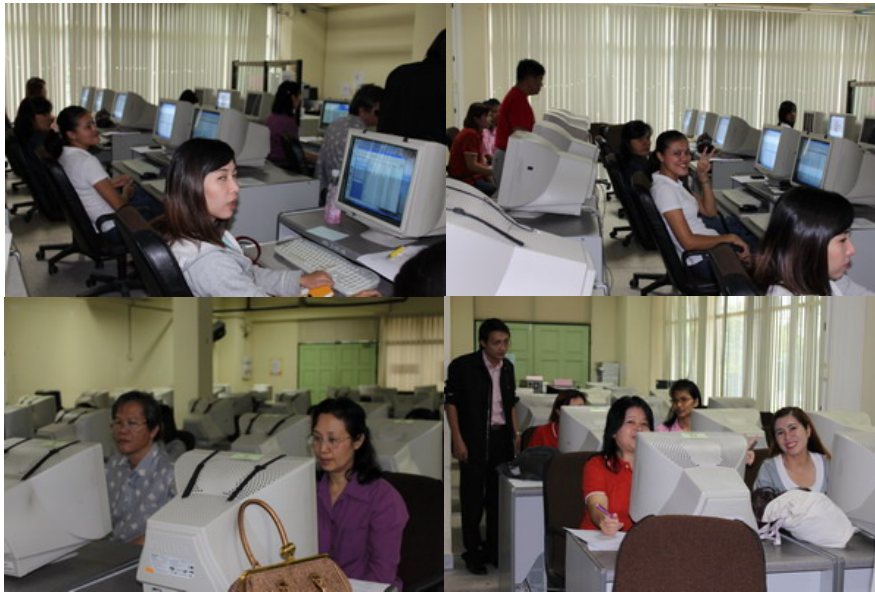
บรรยากาศ วันที่ 8 สิงหาคม 2552